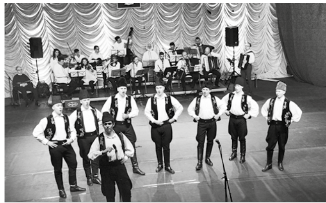
КУД „Бард“ гради дух заједништва