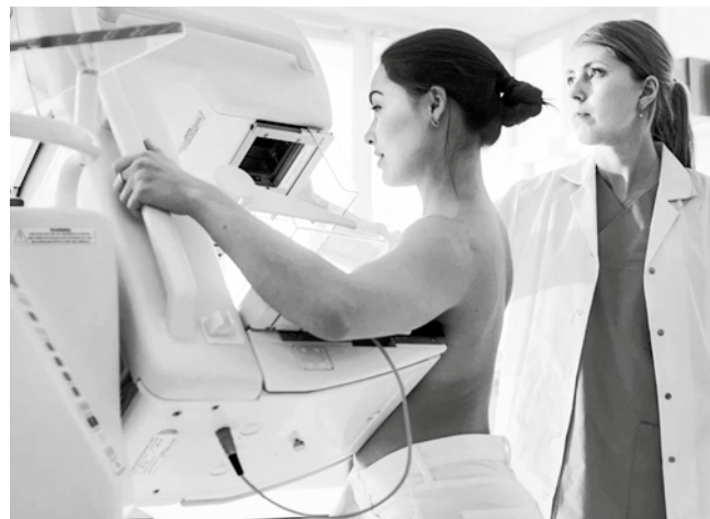
Најбоље за пацијенткиње општине Србобран

нешто савременији и квалитетнији. Поред свега наведеног, показало се да је потребно додатно побољ-