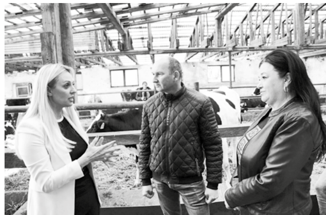
Задовољни субвенцијама државе

„Наши пољопривредници се веома интересују