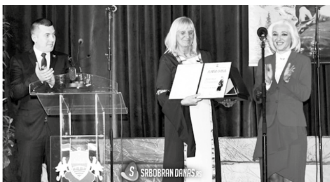
Изложба слика „У Ленкином прстену“