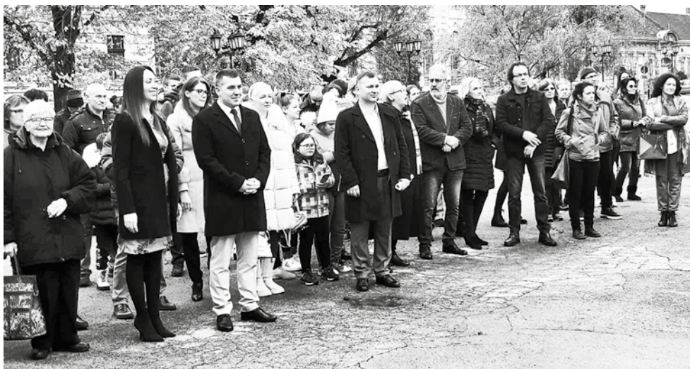
Један од заједнички финансираних пројеката