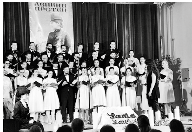
Нове чињенице о породици Дунђерским спремне за зборник број 2

ди и части која јој је укавана у Србобрану избором жирија, награђена песникиња није крила да истински осећа да јој се овога пута посрећило. „Ове године по четврти пут била сам у ужем избору за награду. Посрећило ми се у години за коју ће остати везано да се баш у њој от-