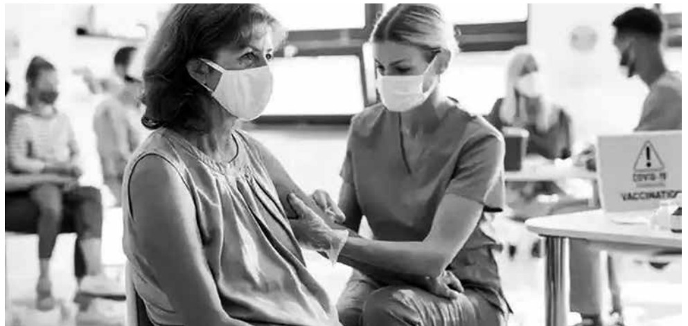
Најтежи облици COVID-19 јављају се код дијабетичара