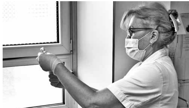
Пријави се за вакцинацију у Дому здравља