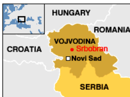
Положај општине Србобран у односу на регион